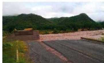
Puente afectado por el torrente de un río en la entidad.