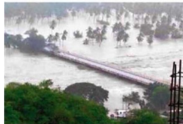
Grandes extensiones de terreno a lado de cauces resultaron inundados.

Legisladores difundieron fotos de los daños que causó el meteoro sin identificar los sitios.