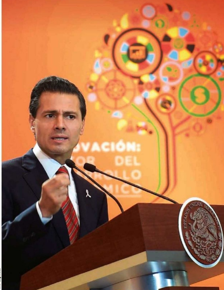
EL MANDATARIO dictó, ayer, una conferencia en la Cumbre de Negocios.

EL PRESIDENTE asegura que el organismo internacional reconoce el desarrollo y el crecimiento por las reformas aprobadas; el Jefe del Ejecutivo resalta que el país avanzó 14 escaños en reporte del Banco Mundial sobre los lugares para invertir; "innovar es la oportunidad para las empresas", afirma.