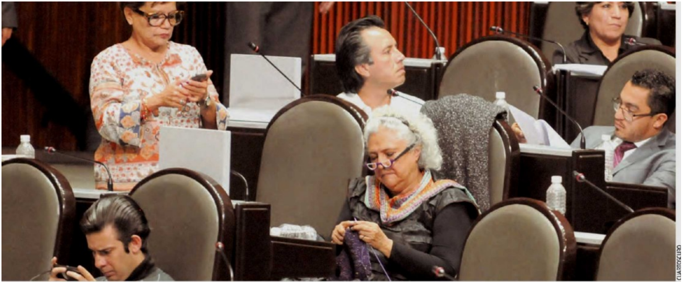
El lado B de San Lázaro. La escritora Laura Esquivel, diputada de Movimiento Regeneración Nacional (Morena), llevó por tercera ocasión su estambre y agujas al Salón de Plenos, aunque rechazó faltar a su labor legislativa por tejer durante las sesiones; incluso, colocó una cartulina en su curul con la leyenda "Recomponiendo el tejido social".