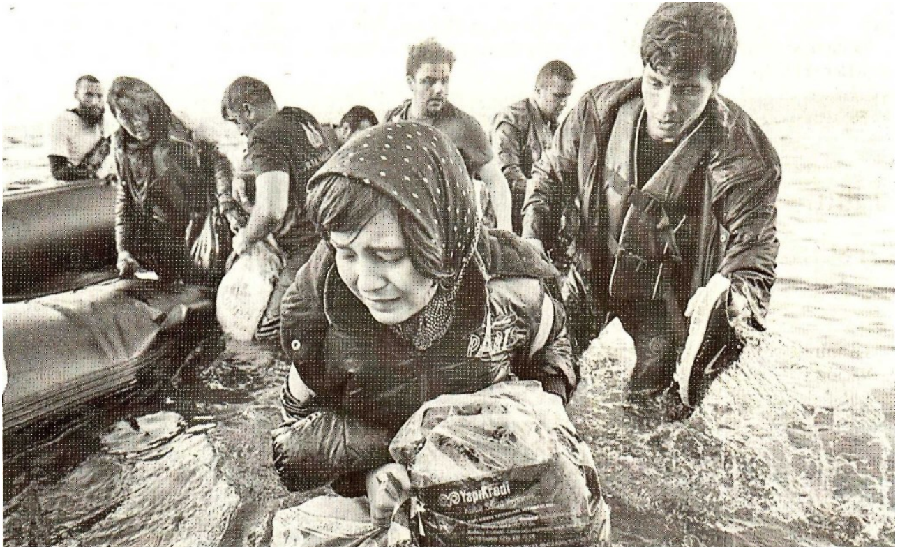
LA MIGRACIÓN en el mundo hoy paga pecados ajenos, derivados de los veinte grandes atentados terroristas de los yihadistas ocurridos en 2015.

o marítima o de aeropuertos que transporte público colectivo, inter- presten servicios a la aviación civil; estatal o internacional, o los haga así como de una nave, aeronave, desviar de su ruta o destino”. máquina o tren ferroviarios , auto- buses o cualquier otro medio de (Continuará).