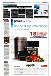
El accidente ocurrió en el kilómetro 145 de la carretera libre Saltillo-Torreón, a la altura del ejido San José de la Paila, en Coahuila.