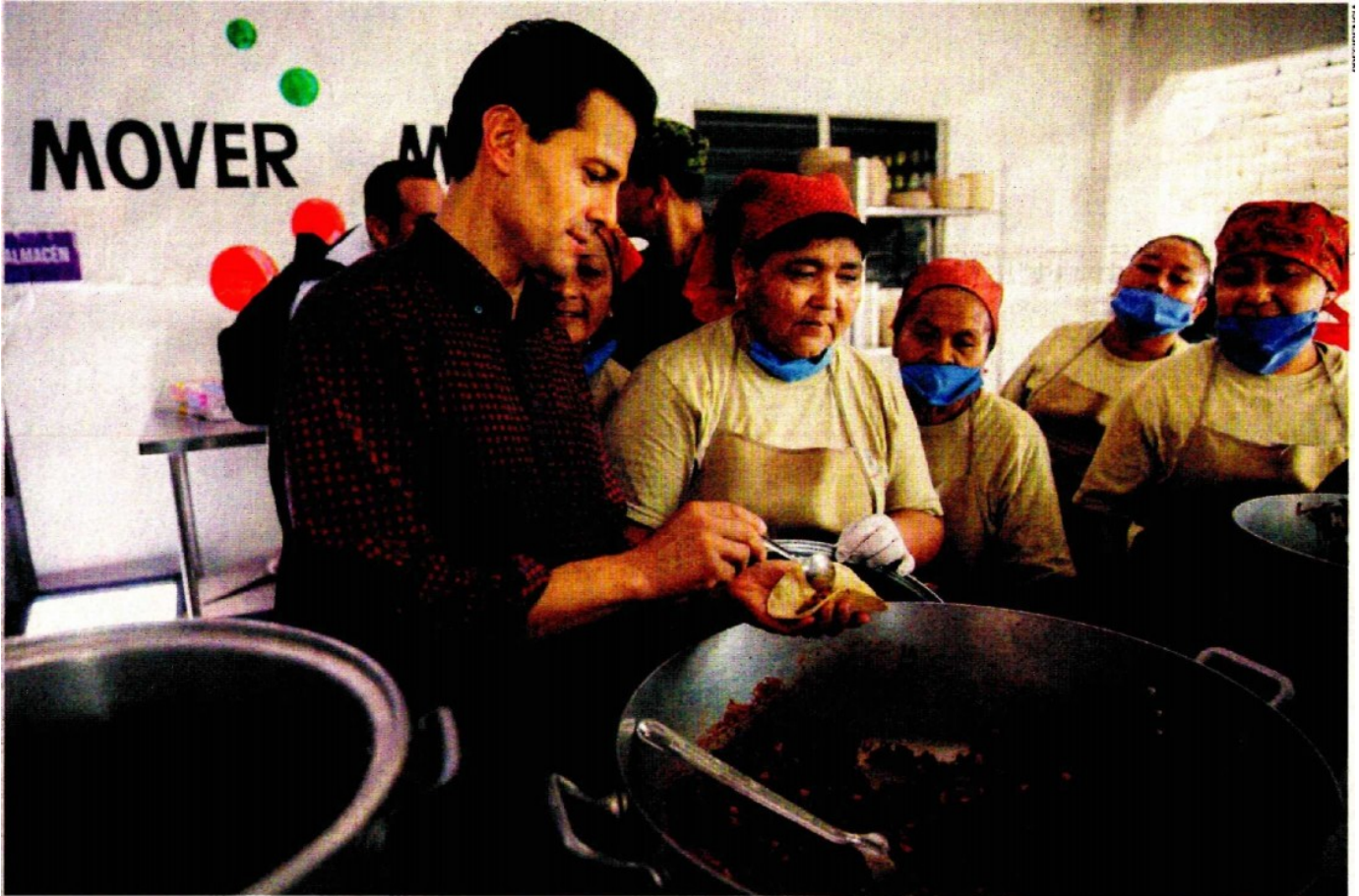
En su visita a Guerrero, el presidente Enrique Peña Nieto encabezó el arranque de 200 comedores comunitarios, los cuales se suman a los mil que operan en el estado. En la comunidad Tres Palos presenció la apertura del centro Laguna Diamante, en donde convivió con los habitantes de la zona.