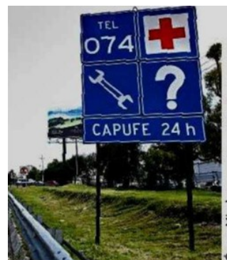
Camino a Querétaro no hay teléfonos SOS a lo largo de la ruta.