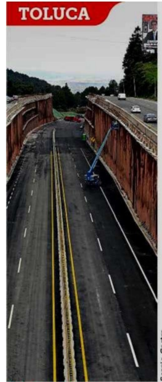
POCO A POCO. A la altura de la zona de La Marquesa es posible ver algunos avances.