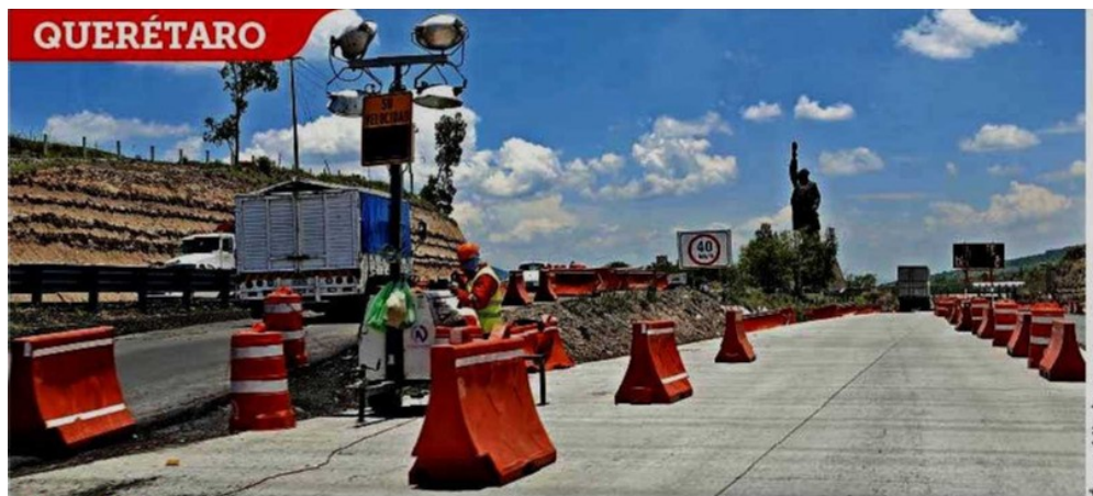
A MEDIAS. En este tramo ya fue reemplazada la mitad de la carpeta asfáltica.