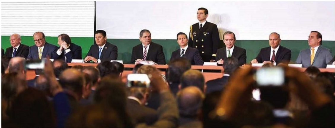
ACOMPAÑANDO al Presidente Enrique Peña estuvo el gobernador de Morelos, Graco Ramírez, ayer.

13 Mil tractores fueron entregados en apoyo al sector agropecuario 150 Destinos internacionales tienen los productos del agro mexicano