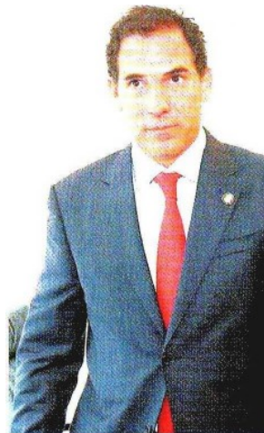
Senado de la República

Esta semana inicia la primera ronda de la renegociación del Tratado de Libre Comercio de América del Norte (TLCAN), por lo cual representantes de la iniciativa privada sostuvieron una reunión con la Mesa Directiva del Senado, presidida por Pablo Escudero Morales , para hablar sobre el tema y las inquietudes del sector empresarial. Al finalizar la reunión privada, el senador ecologista informó que al concluir la primera ronda de negociación, a efectuarse en Washington, se realizará una segunda reunión entre senadores y empresarios para saber qué es lo que observaron desde "el cuarto de al lado". Se espera que dicha reunión se realice en los primeros días de septiembre.