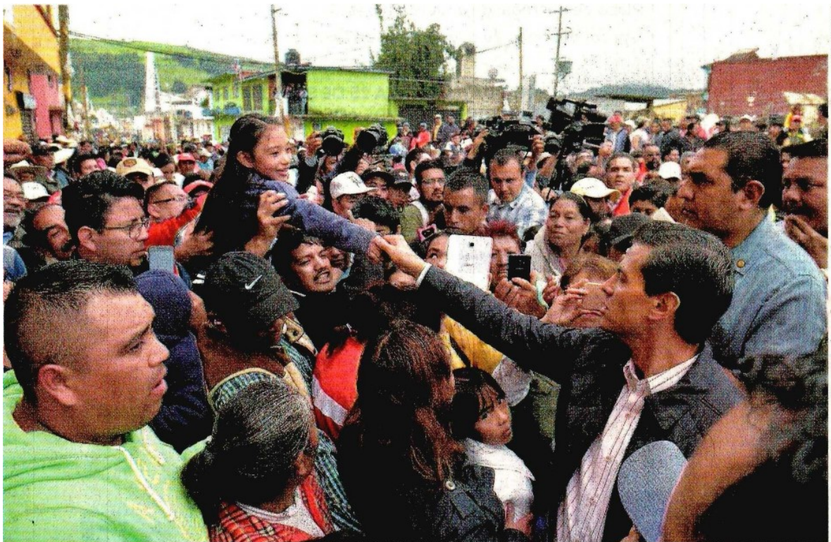
El presidente Enrique Peña Nieto reiteró que la estrategia de reconstrucción será la misma para todos los lugares afectados tanto por el sismo del 7, como por el del 19 de septiembre.