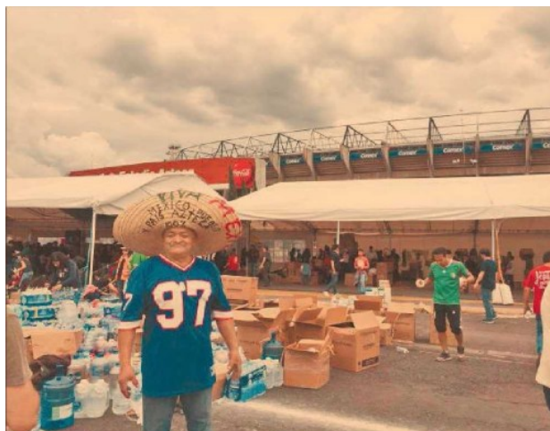
El Estadio Azteca ha sido en uno de los principales centros de acopio. Hoy estará abierto hasta las 16:00 horas.

Informó que durante todo septiembre brindará los servicios de contención psicológica así como orientación legal en el Centro de Atención Integral de la Ciudad de México y en albergues de la capital y en los estados de Guerrero, Oaxaca, Chiapas y Morelos.