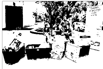
Productos para los niños es lo que se recolecta.