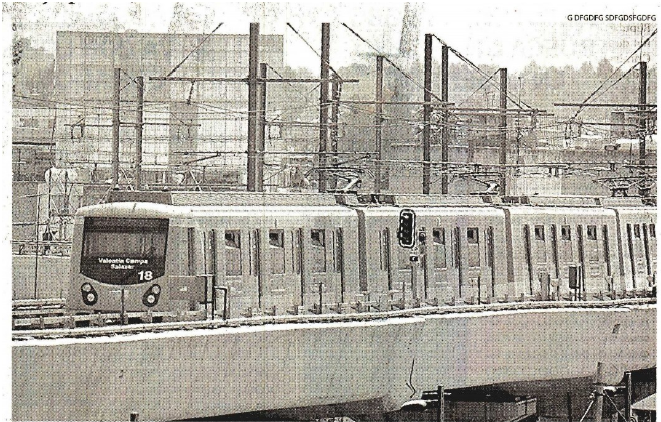
EL JEFE de gobierno dijo que los trabajos iniciarán el próximo año