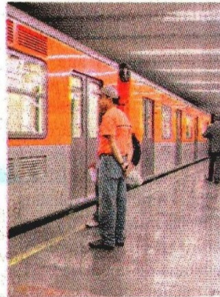
PARA LA obra del Cetram el jefe de gobierno solicita 2 mil millones de pesos