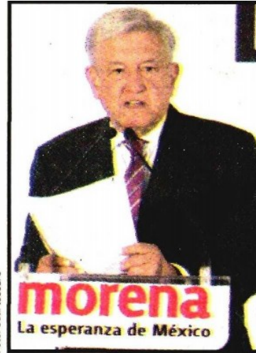
Andrés Manuel López Obrador.

delito y expertos la amnistía a criminales que se readapten.