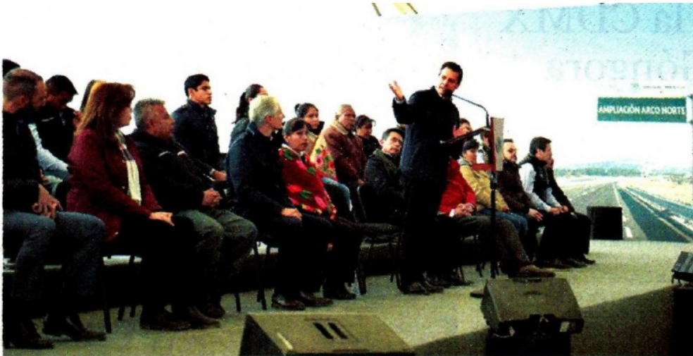
El Primer Mandatario afirma que "Vamos en la ruta de cumplir los proyectos de infraestructura carretera que nos comprometimos a realizar: 52 autopistas y 80 carreteras federales"