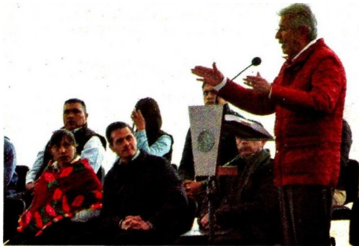
Gerardo Ruiz Esparza, secretario de Comunicaciones y Transportes, enfatiza que la ampliación de la Autopista Arco Norte, en el tramo Jilotepec-Atlacomulco, tuvo una inversión de 2 mil millones de pesos y generó 6 mil 400 empleos durante su construcción