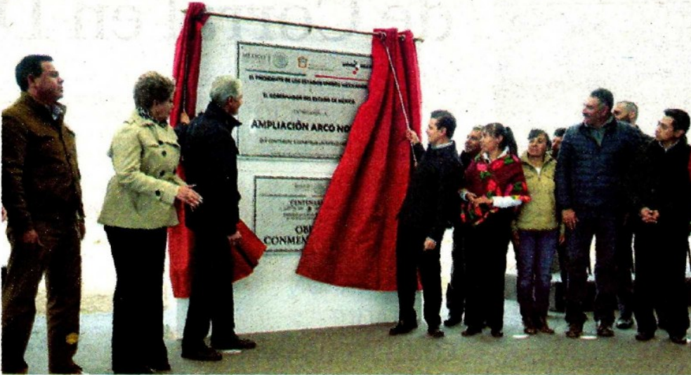
Entregó el Ejecutivo federal la ampliación de la Autopista Arco Norte, tramo Atlacomulco-Jilotepec