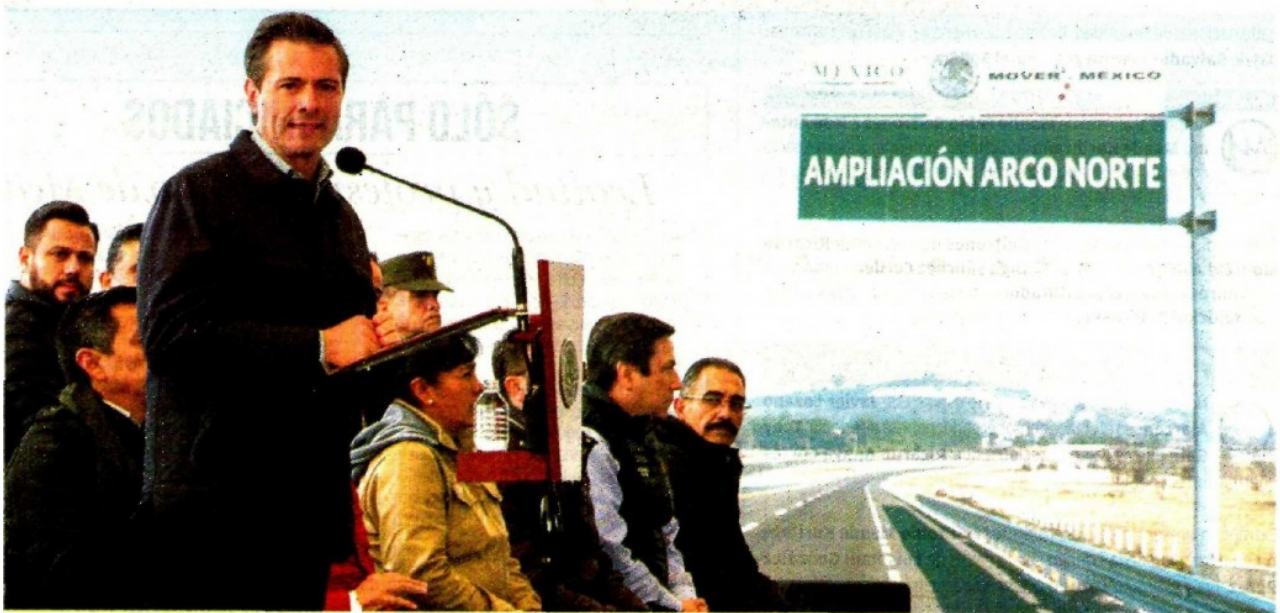
El Presidente Enrique Peña Nieto expresa que 'No permitamos que la competencia democrática, que es sana, que es favorable a nuestra condición de país por su vocación democrática, nos divida como sociedad'