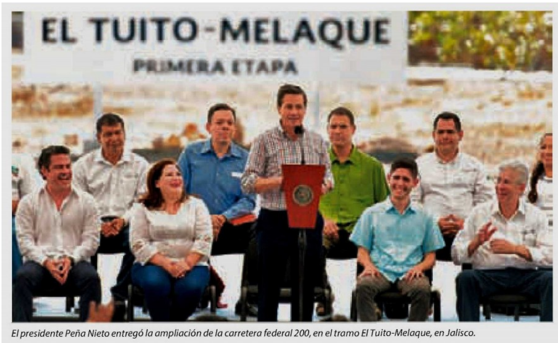
El presidente Peña Nieto entregó la ampliación de la carretera federal 200, en el tramo El Tuito-Melaque, en Jalisco.