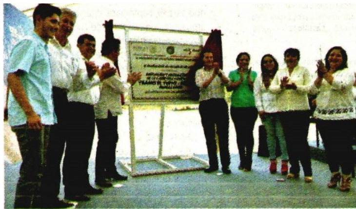
El Ejecutivo federal entrega la primera etapa de la ampliación de la carretera federal 200, tramo El Tuito-Melaque