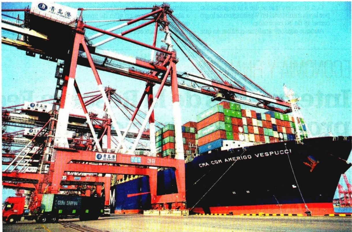
De acuerdo con cifras oficiales, China es el segundo socio comercial de México, con un intercambio total de 80 mil mdd.