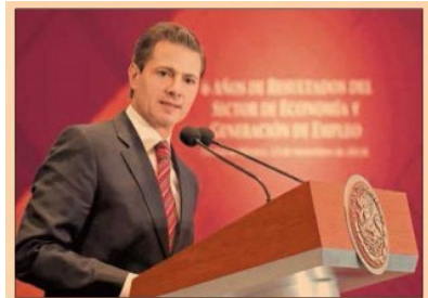
Enrique Peña , presidente de México, ayer, en la reinaugurada sede la SE.