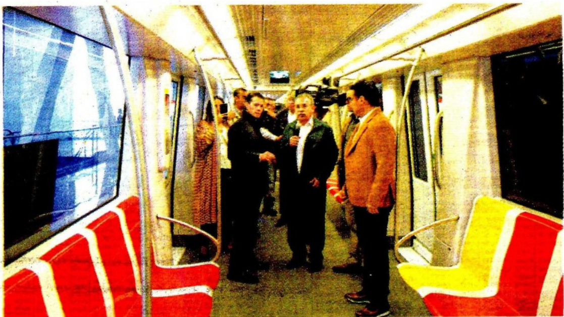
Presidente Peña supervisó la operación del Tren Ligero de la Línea 3