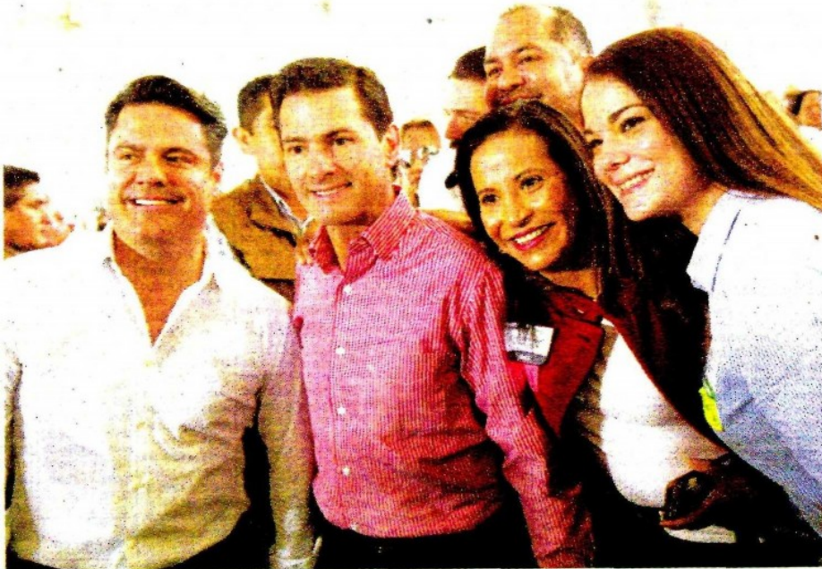
El Ejecutivo federal sigue manteniendo la cercanía con la ciudadanía