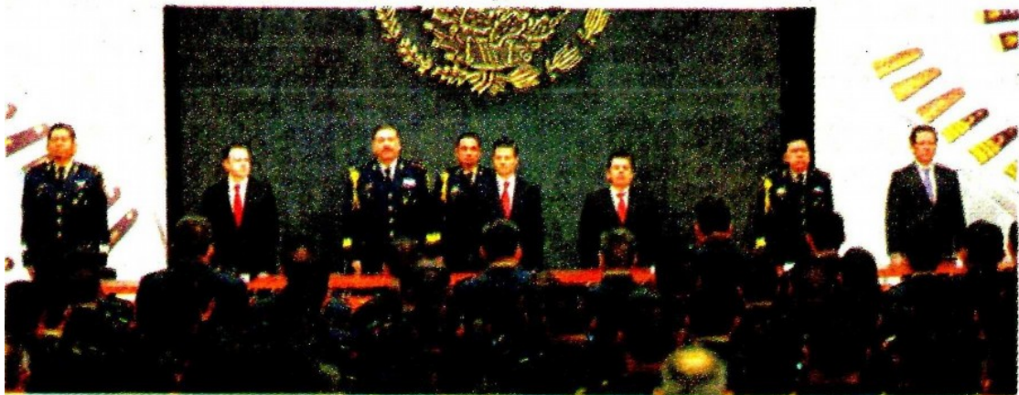
El Estado Mayor Presidencial comenzó a retirar la escolta con la que contaban los secretarios de Estado de la actual administración