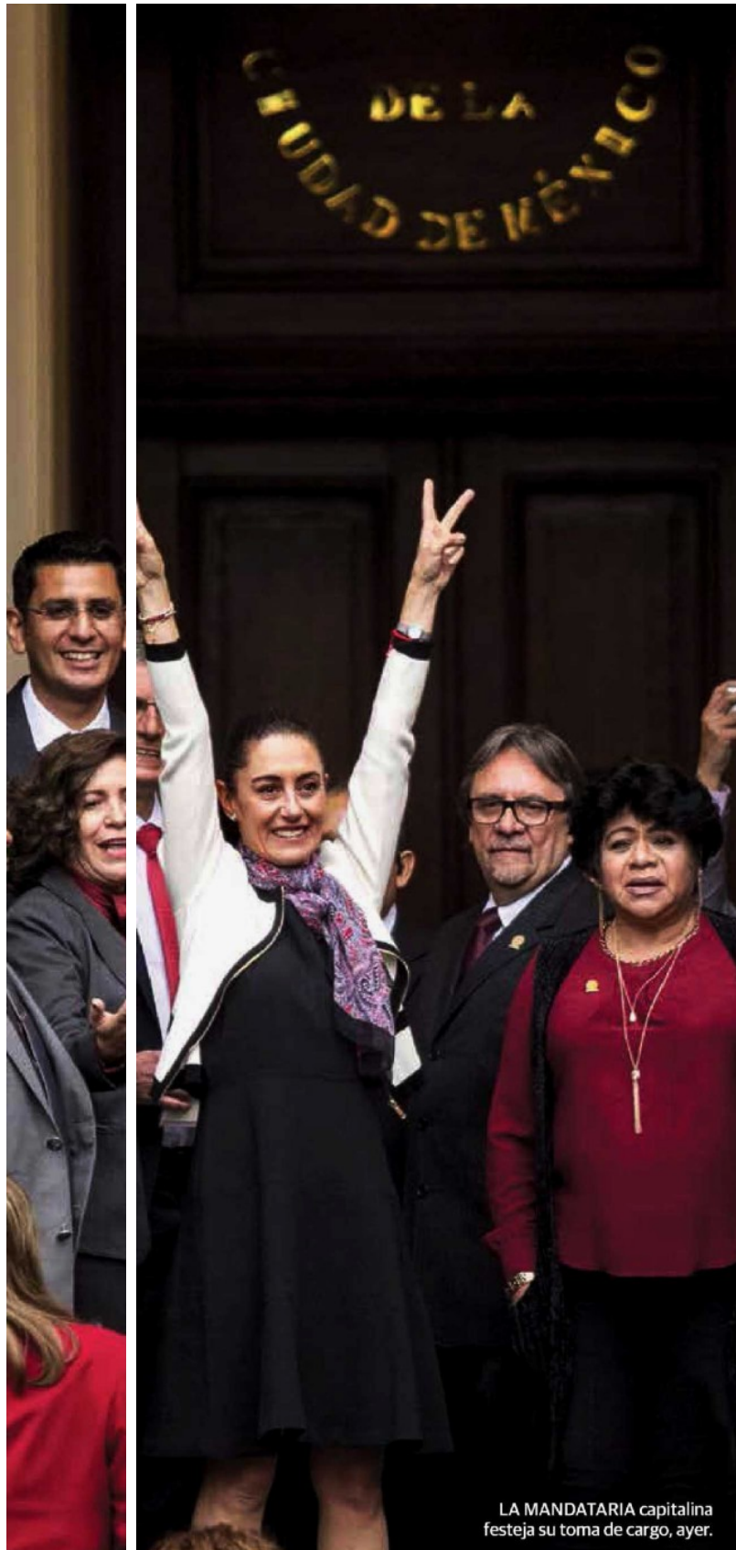
LA MANDATARIA capitalina festeja su toma de cargo, ayer.