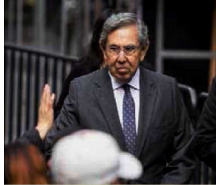
El exjefe de Gobierno Cuauhtémoc Cárdenas caminó rumbo al Congreso local, ayer.

A la ceremonia de toma de mando, en el Palacio Legislativo de Donceles acudieron conocidas figuras.