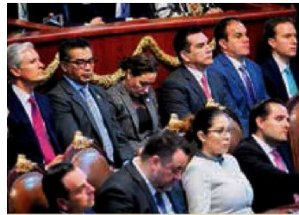
Acudieron gobernadores como Alfredo del Mazo, Cuauhtémoc Blanco y Manuel Velasco.