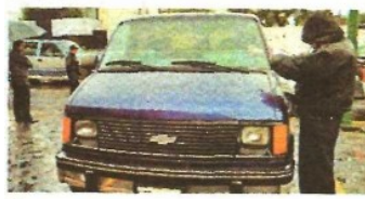
Con seguros, en 2018 En la entidad fueron robados 25 mil 913

AMIS. La Asociación Mexicana de Instituciones de Seguros detalla que el Edomex ocupa el primer lugar del país en robo de vehículos asegurados durante el 2018; Tlalnepantla ocupa la tercera posición