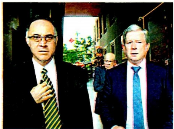
Rogelio Zambrano (derecha), presidente del Consejo de Administración de Cemex