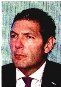
Carlos Hank González

Obrador. El organismo lleva varios meses festejando el aniversario, sin que hasta el momento el mandatario participe en las celebraciones. Habrá que ver si en las próximas jornadas el presidente se anima a participar en las celebraciones del organismo central. Nos cuentan que el viernes, la gran sorpresa en el evento de Banco de México fue la presencia del exgobernador Agustín Carstens , así como también de Guillermo Ortiz y Miguel Mancera , quienes destacaron la importancia de la autonomía en un contexto de bajo crecimiento y presiones externas. Habrá que ver qué tanto el Banco de México aguanta la presión de naciones como Estados Unidos, que aún no definen con claridad cuál será el rumbo de su política económica.