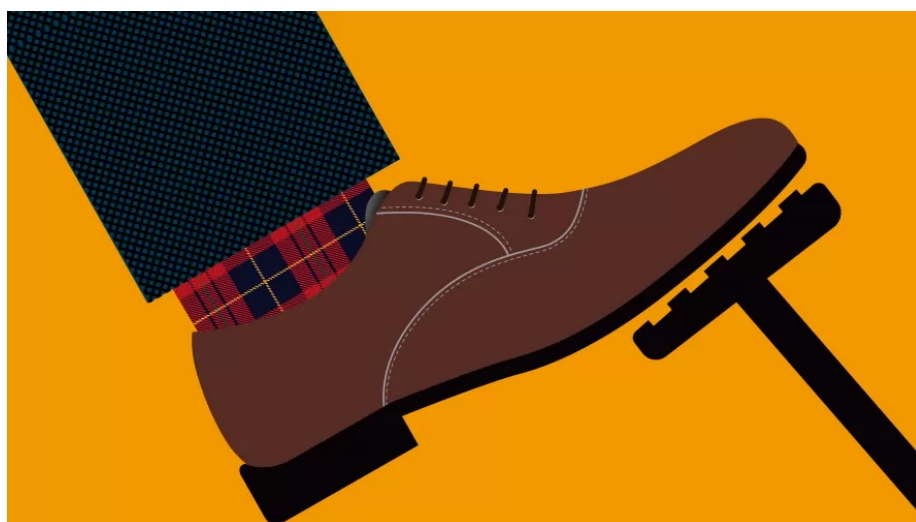
Ilustración de Óscar Castro

Suscríbete GRATIS a nuestro servicio de newsletter