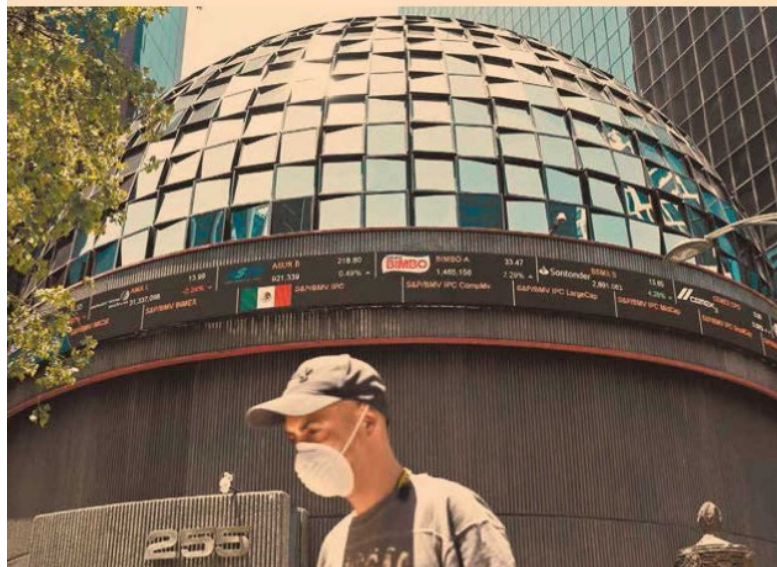
La perspectiva para las emisoras se complicó por el brote vírico.