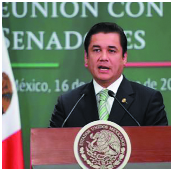
Carlos Puente, líder del PVEM.

no dijo NADA. Sus compañeros del sexenio en contra de las energías limpias y ellos en modo silencio. ¡Pero son el quesque partido VERDE! Fue hasta el lunes que postearon en Twitter un mensaje que decía: el Partido Verde respeta la decisión del gobierno federal , toda vez que responde a un acto que se encuentra facultado a ejercer. ¡Quihúboles! Qué vergüenza, qué acomodaticios... bueno, de ese pie siempre han cojeado.