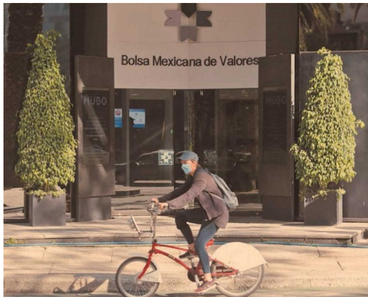
Gran parte de las emisoras de la Bolsa mexicana no ha decidido sobre el pago de dividendos a los accionistas.